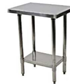
ステンレス架台 750*600*650 (W*L*H)