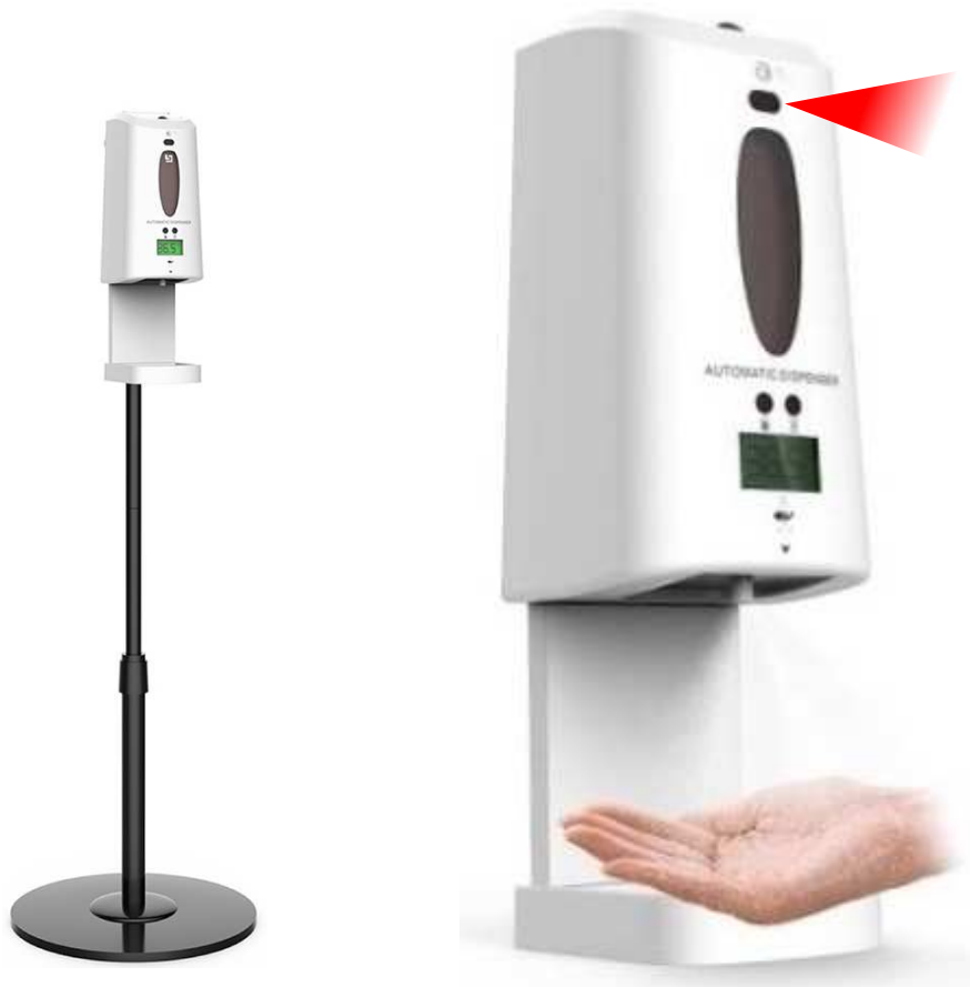
専用スタンド(白・黒)オプション